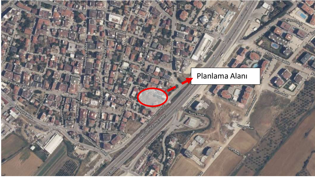
Şekil1: Uydu fotoğrafı (yakın)

1/1000 ölçekli Uygulama İmar Planı Değişikliği hazırlanan 419 Ada; Çanakkale İli, Merkez İlçesi, Kepez Beldesi'nde konumlanmaktadır. 419 adanın, doğusundan "Çanakkale-İzmir" otoyolu geçmekte olup Ayşe Sultan 4. Sokağına cephesi bulunmaktadır.