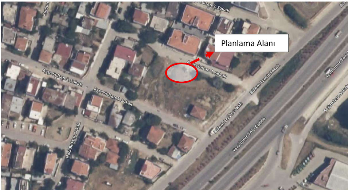
Şekil2: Uydu fotoğrafı (uzak)